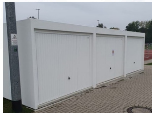
Garagen für den KSC

Seit 1972 gibt es unseren Kamener Sportclub. Zahlreiche Kinder und Jugendliche haben in dieser Zeit hier das Fußballspielen gelernt. Die Mitglieder des Clubs der 72er unterstützen diese Ausbildung mit einer jährlichen Spende von 100€. Die Jugendabteilung und der Förderverein danken allen hier genannten Mitgliedern für ihre Unterstützung