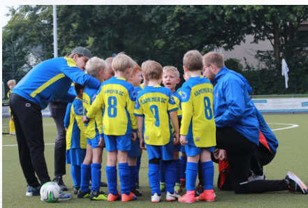
Die kleinsten im Verein, unsere Minis