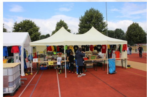
Tombola bei den Turnieren

Seit 1972 gibt es unseren Kamener Sportclub. Zahlreiche Kinder und Jugendliche haben in dieser Zeit hier das Fußballspielen gelernt. Die Mitglieder des Clubs der 72er unterstützen diese Ausbildung mit einer jährlichen Spende von 100€. Die Jugendabteilung und der Förderverein danken allen hier genannten Mitgliedern für ihre Unterstützung